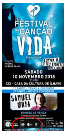
Grupo de Jovens "A TULHA" - Associação Cultural e Recreativa da Gafanha de Aquém "FESTIVAL NACIONAL DA CANÇÃO VIDA 2018"