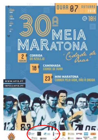
AFIS/OVAR - Atletas Fim de Semana "30.ª MEIA MARATONA "CIDADE DE OVAR""