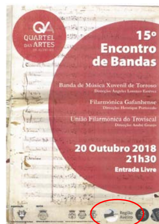
União Filarmónica do Troviscal "15.º ENCONTRO IBÉRICO DE BANDAS DO TROVISCAL"