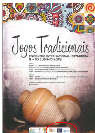
ACRAP - Associação Cultural e Recreativa dos Amigos das Póvoas "ENCONTRO INTERNACIONAL DE JOGOS TRADICIONAIS"