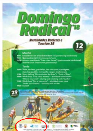
Ruralidades e Memórias "RURALIDADES RADICAIS"