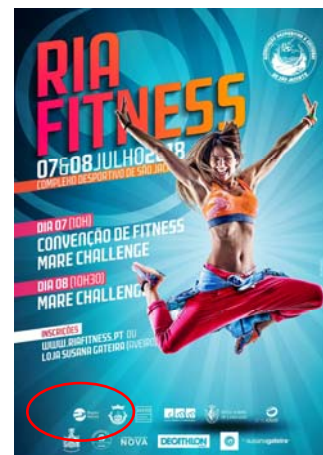
Associação Desportiva e Cultural de São Jacinto "VI RIA FITNESS"