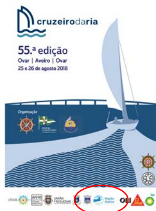
Sporting Clube de Aveiro "PROJETO "SER+RIA""