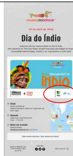
Grupo Cénico Arlequim (Museu do Brincar) "HÁ ÍNDIOS DO LADO DE LÁ DO OCEANO"