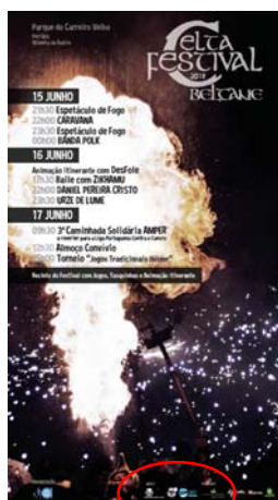
AMPER - Associação dos Amigos de Perrões "BELTANE FESTIVAL CELTA - EDIÇÃO 2018"