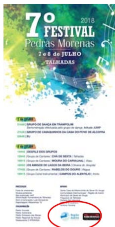
Associação Irmãos Unidos das Talhadas "FESTIVAL PEDRAS MORENAS 2018 - 7.ª EDIÇÃO"