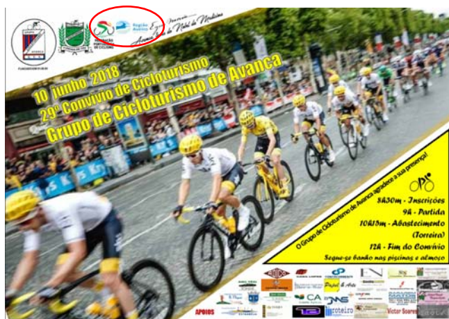
Grupo de Ciclismo de Avanca "29.º CONVÍVIO DO GRUPO DE CICLOTURISMO DE AVANCA"