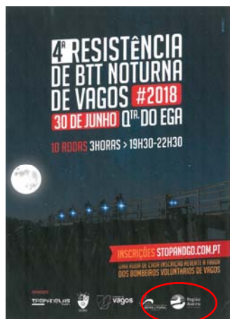
Associação de Ciclismo Trepanelas "4.ª RESISTÊNCIA BTT NOTURNA DE VAGOS"