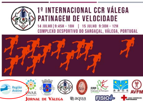
Centro Cultural e Recreativo de Válega "1.º INTERNACIONAL CCR VÁLEGA"