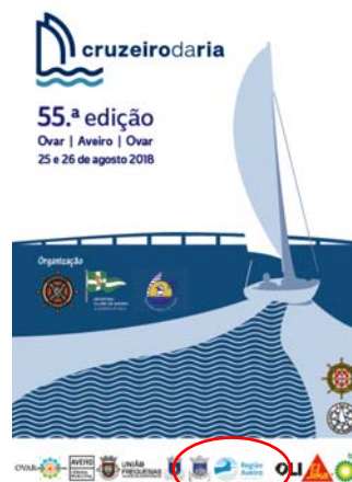
NADO - Náutica Desportiva Ovensense "55.º CRUZEIRO DA RIA "