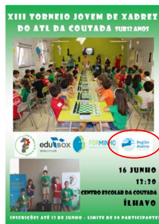
Associação de Pais e Encarregados de Educação dos Alunos da Escola 1º Ciclo Ensino Básico da Coutada "XIII TORNEIO DE XADREZ DO ATL DA COUTADA"