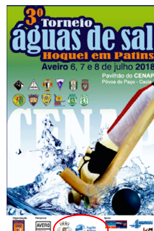
Centro Atlético Póvoa Pacense "3.º TORNEIO "ÁGUAS DE SAL" - 2018"