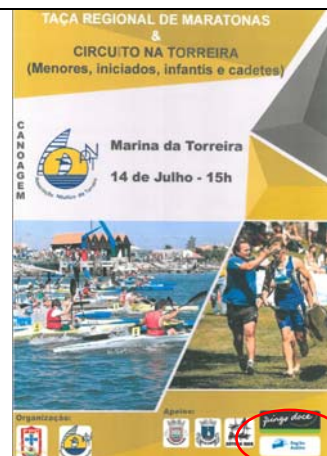
Associação Náutica da Torreira "TAÇA REGIONAL DE MARATONA CENTRO"