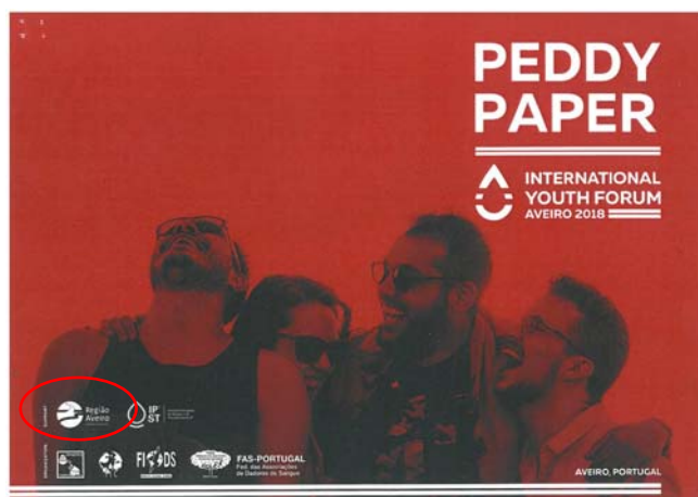
ADASMA - Associação de Dadores de Sangue da Mamarrosa "IYC/FIODS - FÓRUM INTERNACIONAL DA JUVENTUDE"