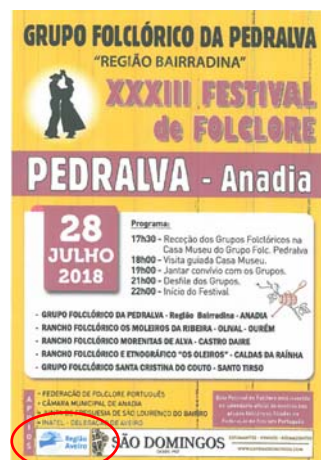
Grupo Folclórico da Pedralva - Região Bairradina "XXXIII FESTIVAL DE FOLCLORE"