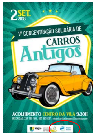
Santa Casa da Misericórdia de Vagos "CONCENTRAÇÃO SOLIDÁRIA DE CARROS ANTIGOS"