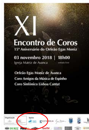
Escola de Artes de Avanca - Orfeão Egas Moniz "XI ENCONTRO DE COROS - 15.º ANIVERSÁRIO DO OEM"