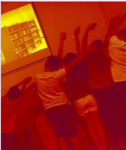
BIBLIOTECA MUNICIPAL JOÃO GRAVE – VAGOS