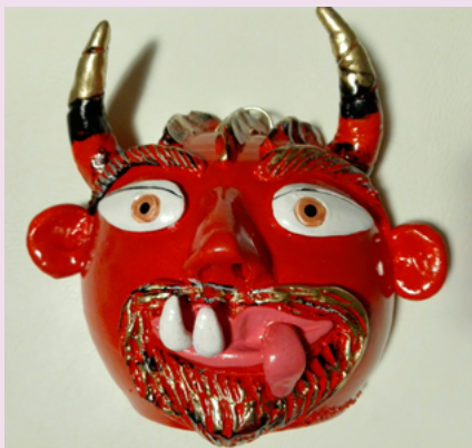
BIBLIOTECA MUNICIPAL DE SEVER DO VOUGA