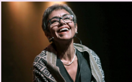
BIBLIOTECA MUNICIPAL MANUEL ALEGRE – ÁGUEDA

Promotor Biblioteca Municipal de Albergaria-a-Velha Público-alvo Comunidade Leitora em Geral