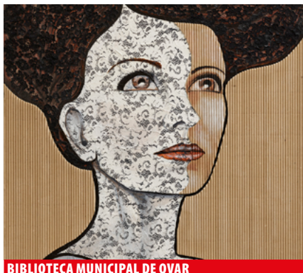
BIBLIOTECA MUNICIPAL DE OVAR