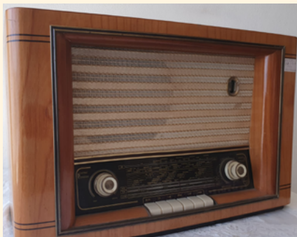
BIBLIOTECA MUNICIPAL MANUEL ALEGRE – ÁGUEDA

Horário(s) 21h00 Promotor Biblioteca Municipal de Albergaria-a-Velha Público-alvo Famílias com crianças até aos 12 anos