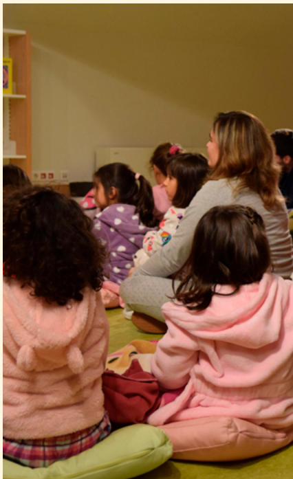
BIBLIOTECA MUNICIPAL DE ALBERGARIA-A-VELHA