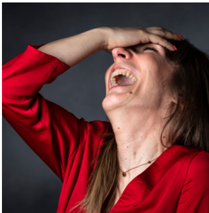
BIBLIOTECA MUNICIPAL DE SEVER DO VOUGA