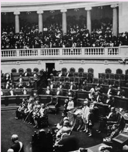
BIBLIOTECA MUNICIPAL DE ALBERGARIA-A-VELHA