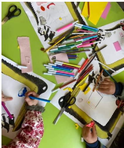
BIBLIOTECA MUNICIPAL JOÃO GRAVE – VAGOS

Mais info: biblioteca@cm-ovar.pt | http://bmovar.bibliopolis.info/