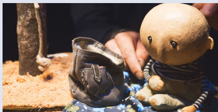
BIBLIOTECA MUNICIPAL DE SEVER DO VOUGA