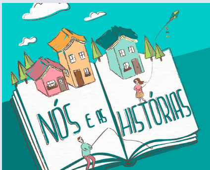
BIBLIOTECA MUNICIPAL DE OLIVEIRA DO BAIRRO

Horário(s) Promotor Sáb.: 14h30 Biblioteca Municipal de Ílhavo Público-alvo Público em Geral