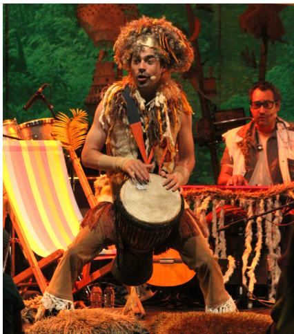
BIBLIOTECA MUNICIPAL MANUEL ALEGRE