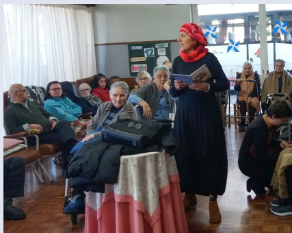
BIBLIOTECA MUNICIPAL DE AVEIRO