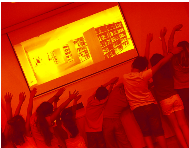
BIBLIOTECA MUNICIPAL JOÃO GRAVE – VAGOS