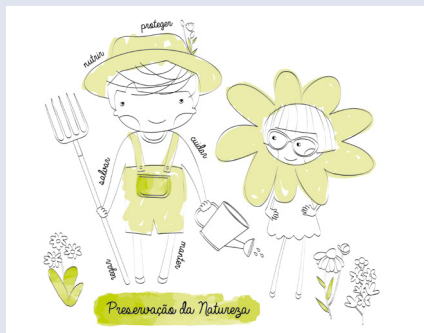
BIBLIOTECA MUNICIPAL DE OLIVEIRA DO BAIRRO

Horário(s) 16h00 Duração 45min. Destinatários Maiores de 3 anos e famílias