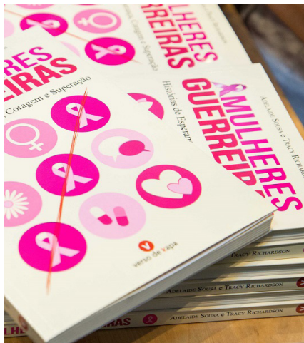
BIBLIOTECA MUNICIPAL DE ESTARREJA

Horário(s) O habitual da BMO Público-alvo Público em geral