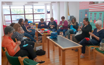
BIBLIOTECA MUNICIPAL DE AVEIRO

Esta atividade associa leituras em voz alta ao empréstimo de documentos.