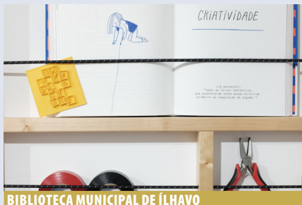
BIBLIOTECA MUNICIPAL DE ÍLHAVO