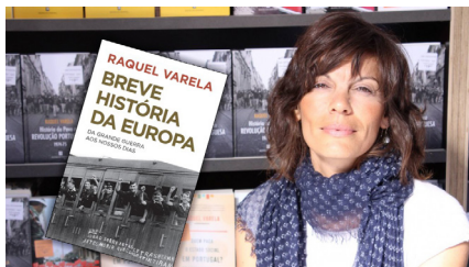
BIBLIOTECA MUNICIPAL DE ALBERGARIA-A-VELHA