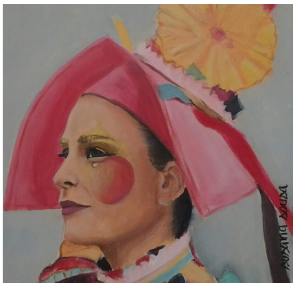
BIBLIOTECA MUNICIPAL DE OVAR