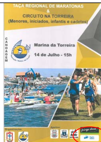
Associação Náutica da Torreira "TAÇA REGIONAL DE MARATONA CENTRO"