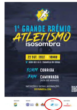
Centro Desportivo e Cultural de Paradelas do Vouga 1.º PRÉMIO DE ATLETISMO C.D.C. PARADELA