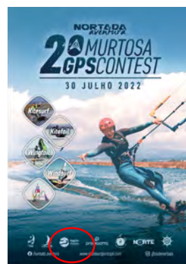
Clube Nortadaventura II MURTOSA GPS OPEN