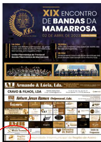
Associação Beneficente, Cultura e Recreio da Mamarrosa XIX ENCONTRO DE BANDAS