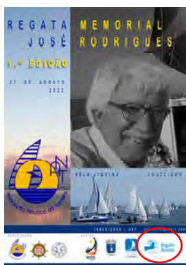
Associação Náutica da Torreira REGATA MEMORIAL JOSÉ RODRIGUES