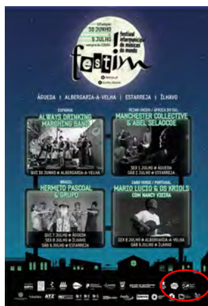
d'Orfeu Associação Cultural FESTIM - FESTIVAL INTERMUNICIPAL DE MÚSICAS DO MUNDO