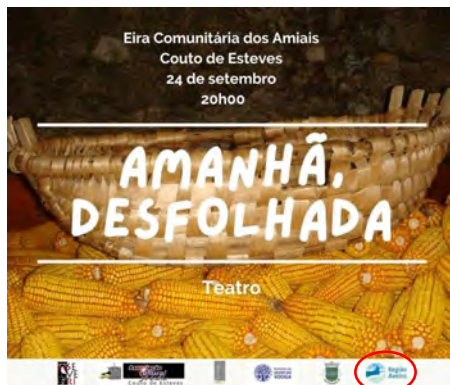
SEVERI - Associação Cultural de Expressão Dramática de Sever do Vouga O PRIMEIRO DIA - CRIAÇÃO ARTÍSTICA SOBRE A FUNDAÇÃO DE SEVER DO VOUGA (Desfolhada)