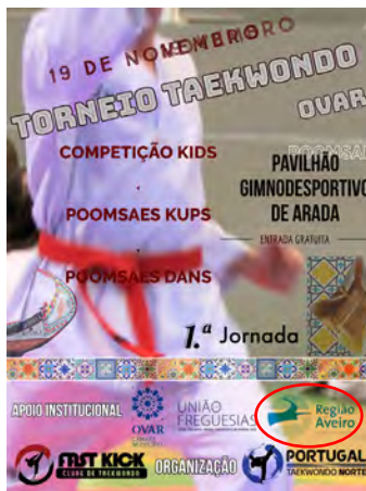
Fast Kick - Clube de Taekwondo TORNEIO DE TAEKWONDO