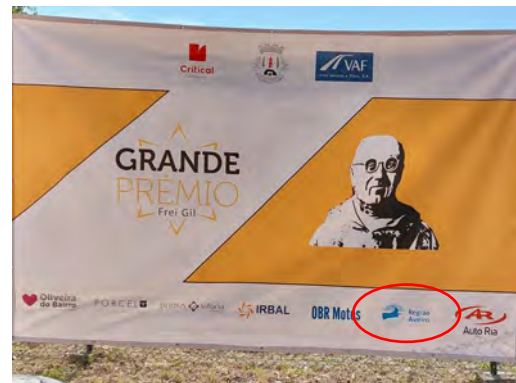
Clube de Energias Renováveis Professor Fernando Ferreira GRANDE PRÉMIO FREI GIL