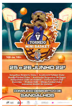
Sangalhos Desporto Clube FESTA INTERNACIONAL DE MINIBASQUETE (8 aos 12 anos)