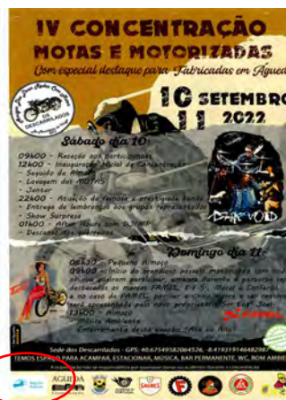
ADDRCM - Associação dos Amigos das Duas Rodas com Motor de Macinhata "Os Descarilados" CONCENTRAÇÃO DE MOTORIZADAS ANTIGAS FABRICADAS EM ÁGUEDA