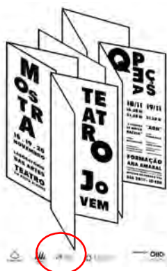
Quinto Palco - Associação Cultural QPEÇAS - MOSTRA NACIONAL DE TEATRO JOVEM