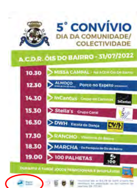
Associação Cultural Desportiva e Recreativa de Óis do Bairro V DIA DA COMUNIDADE / COLETIVIDADE