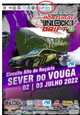
Vouga Sport Clube DRIFT DE SEVER DO VOUGA