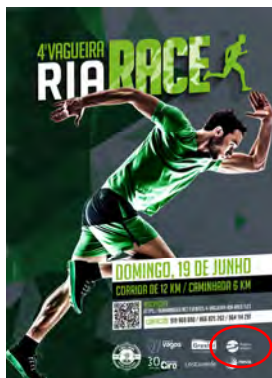
ALWAYS YOUNG - Associação Desportiva Recreativa e Cultural RIA RACE - PRAIA DA VAGUEIRA