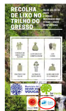
Associação Severde LIMPEZA DE CURSOS DE ÁGUA E TRILHOS PEDESTRES