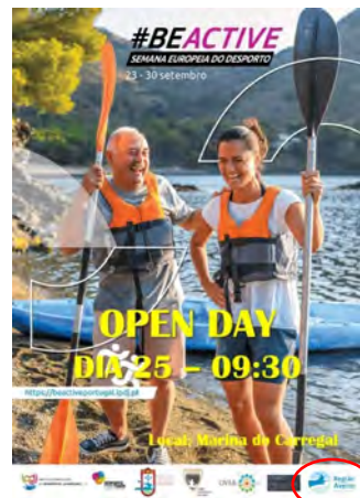
Clube de Canoagem de Ovar (CCOvar) CANOAGEM ATIVA EM OVAR 2022