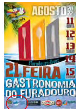
Grupo Recreativo e Carnavalesco Pierrots FEIRA DA GASTRONOMIA DO FURADOURO - 2022 - 21.ª EDIÇÃO