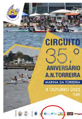
Associação Náutica da Torreira PROVA ANIVERSÁRIO DO CLUBE