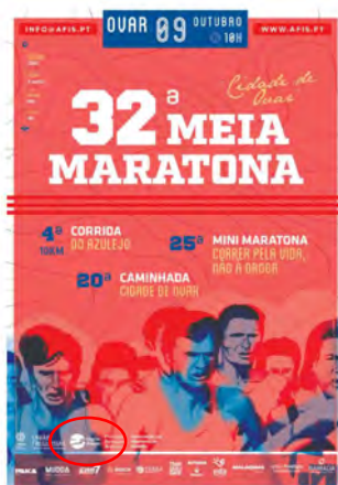
AFIS/OVAR - Atletas Fim de Semana 32.ª MEIA MARATONA "CIDADE DE OVAR"