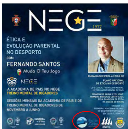
NEGE - Novo Estrela Gafanha da Encarnação NEGE - 3.º ESTRELITA CUP (TORNEIO INT. FUTEBOL FEMININO) / SEMINÁRIO NEGE FUTEBOL+ (A ÉTICA E EVOLUÇÃO PARENTAL NO DESPORTO)