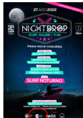
ASV - Associação de Surfistas de Vagos "NIGHT DROP" - SURF NOTURNO 2022