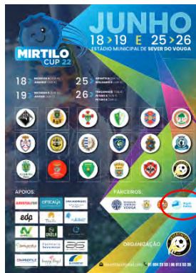
Severfintas Club MIRTILHO CUP'22