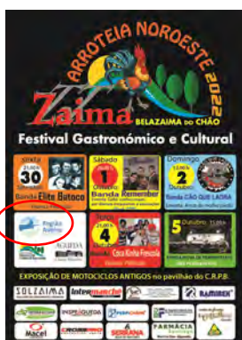
Zaima TT – Clube de Atividades de Lazer e Turismo de Belazaima do Chão ARROTEIA NOROESTE - FESTIVAL GASTRONÓMICO E CULTURAL 22