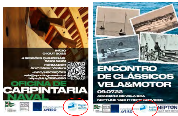
Sporting Clube de Aveiro RIA MAIS ATIVA