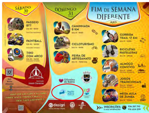
Associação Jovem Oianense FIM DE SEMANA DIFERENTE 2022