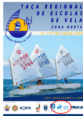
Associação Náutica da Torreira TAÇA REGIONAL DE ESCOLAS DE VELA CLASSE OPTIMIST