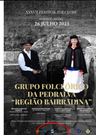
Grupo Folclórico de Pedralva - Região Bairradina XXXVII FESTIVAL DE FOLCLORE