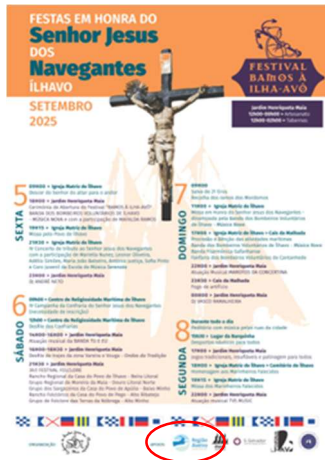
Confraria do Senhor Jesus dos Navegantes FESTIVAL “BAMOS À ILHA-AVÔ”