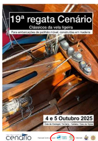
CENÁRIO - Centro Náutico da Ria de Ovar 19.ª REGATA CENÁRIO - CLÁSSICOS DA VELA LIGEIRA