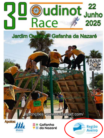
Bússola Partilhada, Associação OUDINOT RACE