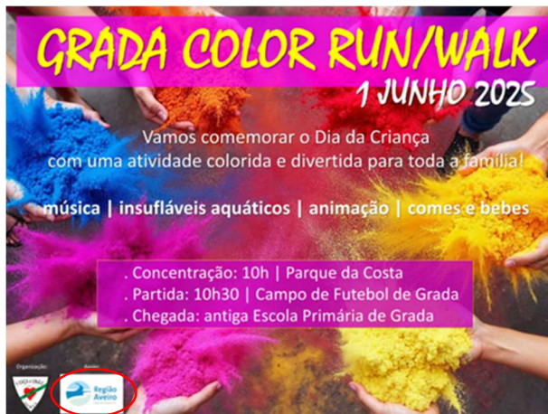
Associação Recreativa de Grada SECÇÃO DE CAMINHADAS, TRILHOS E MARATONAS!