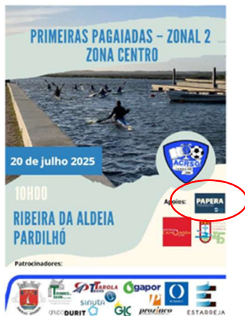
Associação Cultural Recreativa Saavedra Guedes PRIMEIRAS PAGAÍADAS - ZONAL DO CENTRO - PROVA 2