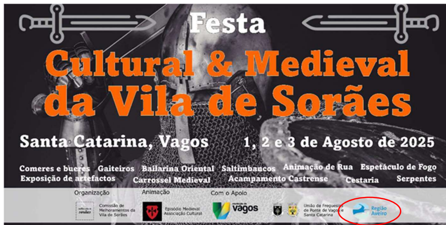
Comissão de Melhoramentos da Vila de Sorões FESTA CULTURAL E MEDIEVAL DA VILA DE SORÃES 2025