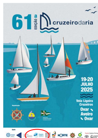
NADO - Náutica Desportiva Ovarense 61.º CRUZEIRO DA RIA