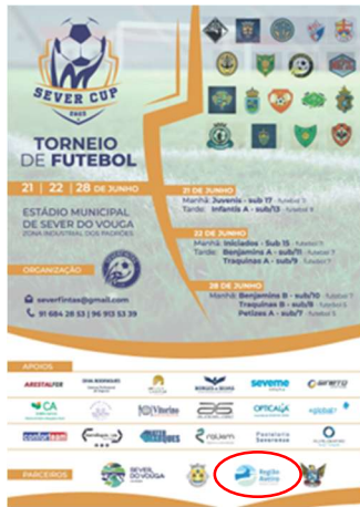
SeverFintas Club SEVER CUP'25