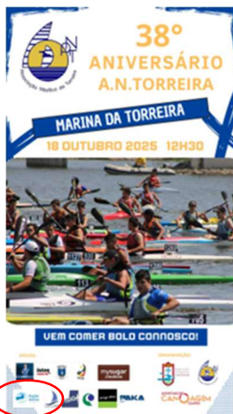
Associação Náutica da Torreira CIRCUITO 38.º ANIVERSÁRIO ANT