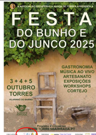
Associação Recuperar a Aldeia de Torres FESTA DO BUNHO E DO JUNCO