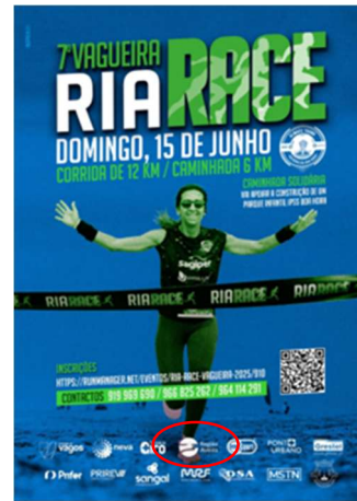
Always Young - Associação Desportiva Recreativa e Cultural RIA RACE - PRAIA DA VAGUEIRA