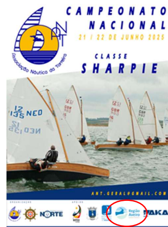
Associação Náutica da Torreira CAMPEONATO NACIONAL DE SHARPIE 12