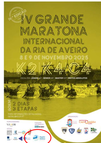
ACCP - Associação de Canoagem do Centro 4.ª GRANDE MARATONA DA RIA DE AVEIRO - CANOAGEM