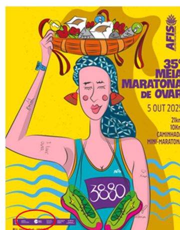
AFIS/OVAR - Atletas Fim de Semana 35.ª MEIA MARATONA "CIDADE DE OVAR"