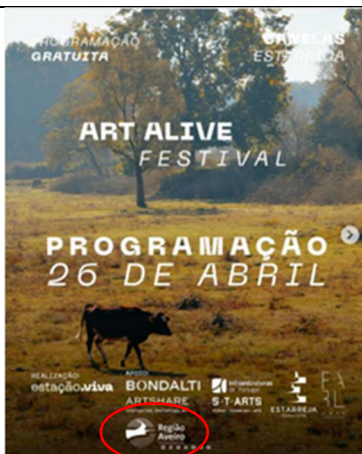
Associação Estação Viva INTEGRAÇÃO CULTURAL: ARTE COMO CAMINHO PARA A INCLUSÃO