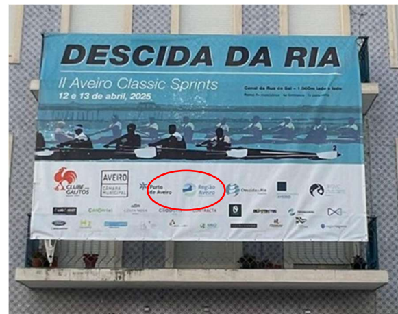
Clube dos Galitos - Secção Náutica DESCIDA DA RIA - II AVEIRO CLASSIC SPRING