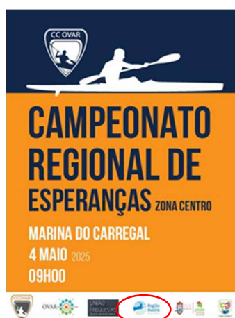
Clube de Canoagem de Ovar CAMPEONATO REGIONAL CENTRO DE ESPERANÇA