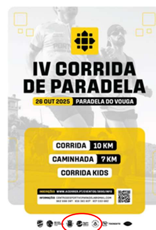
Centro Desportivo e Cultural de Paradela do Vouga 4.º GRANDE PRÉMIO ATLETISMO PARADELA DO VOUGA