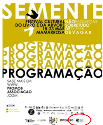
PROMOB - Associação de Promoção e Mobilização da Comunidade SEMENTE - FESTIVAL CULTURAL DO LIVRO E DA ÁRVORE