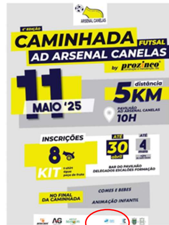
Associação Desportiva Arsenal de Canelas 4.ª CAMINHADA DO ARSENAL 2025 - PASSOS PELO BAIXO VOUGA