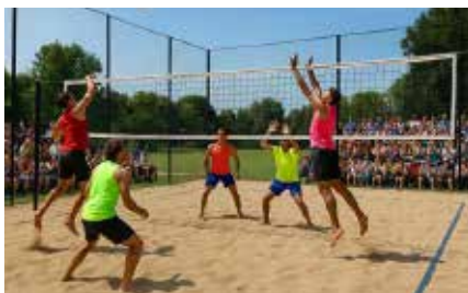
Resultado da fusão de três propostas