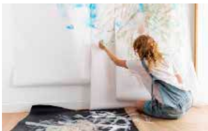
Resultado da fusão de duas propostas