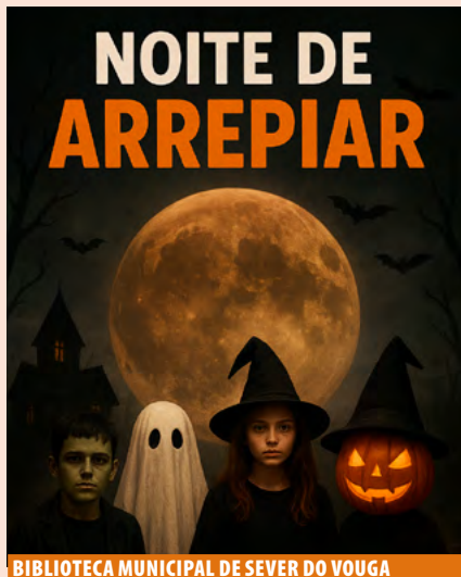
BIBLIOTECA MUNICIPAL DE SEVER DO VOUGA

Promotor Município de Anadia Público-alvo Crianças, entre os 5 e 12 anos de idade