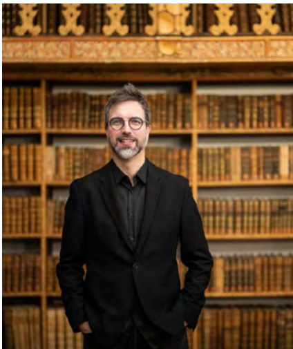
BIBLIOTECA MUNICIPAL DE ALBERGARIA-A-VELHA