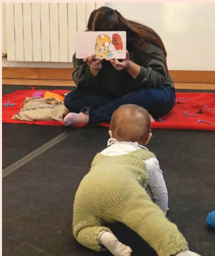
BIBLIOTECA MUNICIPAL DE AVEIRO