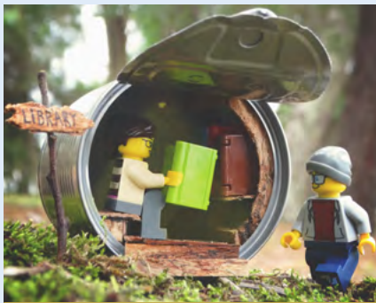
BIBLIOTECA MUNICIPAL DE ÍLHAVO

Crianças a partir dos 3 anos e suas famílias ou escolas/instituições