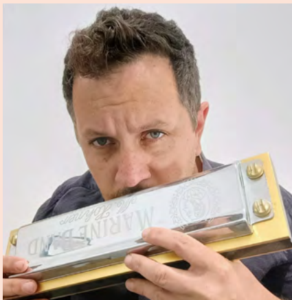
BIBLIOTECA MUNICIPAL MANUEL ALEGRE

Horário(s) 11h00 Promotor Município de Aveiro Público-alvo Famílias com bebés dos 3 aos 36 meses