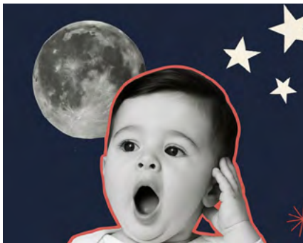
BIBLIOTECA MUNICIPAL DE ÍLHAVO

Horário(s) 20h00 Promotor Município de Aveiro Público-alvo Público em geral