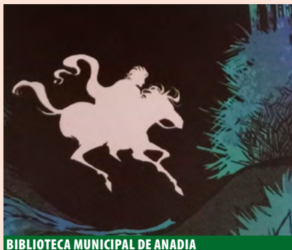
BIBLIOTECA MUNICIPAL DE ANADIA