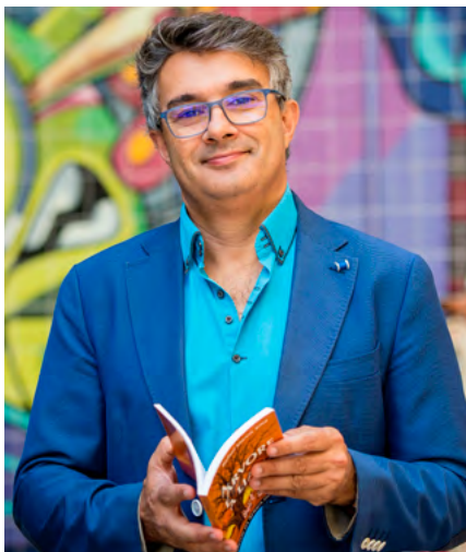
BIBLIOTECA MUNICIPAL DE ALBERGARIA-A-VELHA