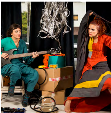
BIBLIOTECA MUNICIPAL MANUEL ALEGRE

Promotor Município de Albergaria-a-Velha Público-alvo Famílias com crianças maiores de 3 anos