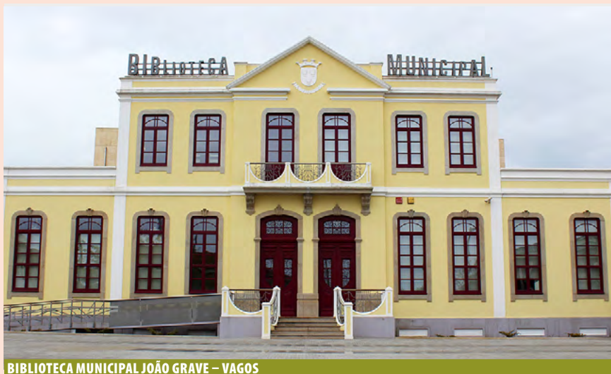
BIBLIOTECA MUNICIPAL JOÃO GRAVE – VAGOS