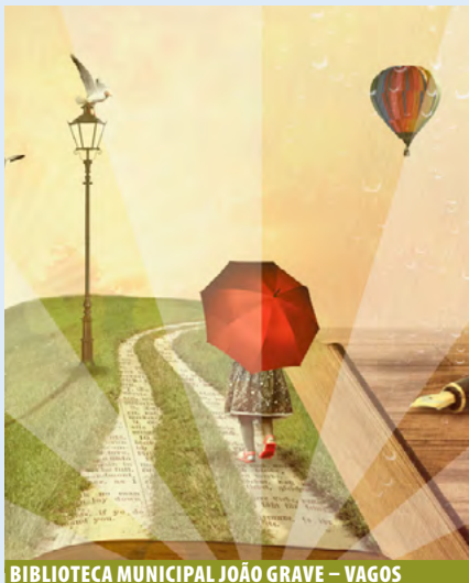
BIBLIOTECA MUNICIPAL JOÃO GRAVE – VAGOS