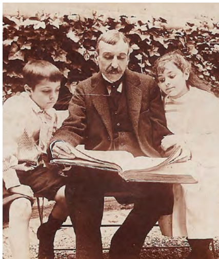
BIBLIOTECA MUNICIPAL DE AVEIRO