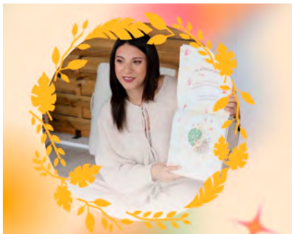
BIBLIOTECA MUNICIPAL DE OLIVEIRA DO BAIRRO

25 DE OUTUBRO, 22 DE NOVEMBRO E 27 DE DEZEMBRO