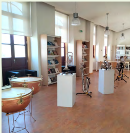
BIBLIOTECA MUNICIPAL JOÃO GRAVE – VAGOS