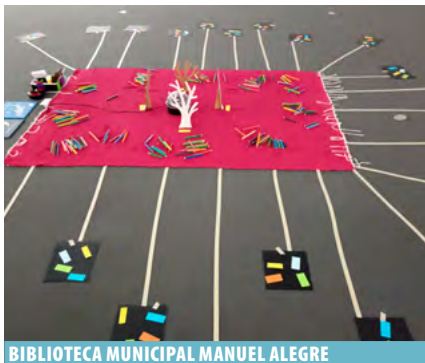
BIBLIOTECA MUNICIPAL MANUEL ALEGRE