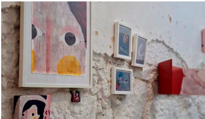
BIBLIOTECA MUNICIPAL DE ÍLHAVO