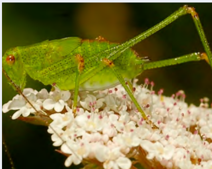
BIBLIOTECA MUNICIPAL DE OVAR

Crianças dos 4 aos 9 anos e um adulto acompanhante