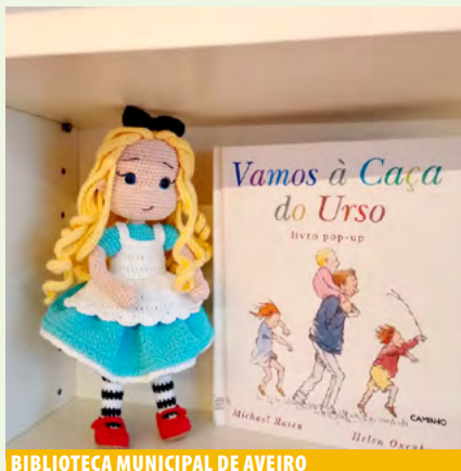
BIBLIOTECA MUNICIPAL DE AVEIRO