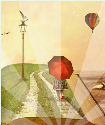
BIBLIOTECA MUNICIPAL JOÃO GRAVE – VAGOS