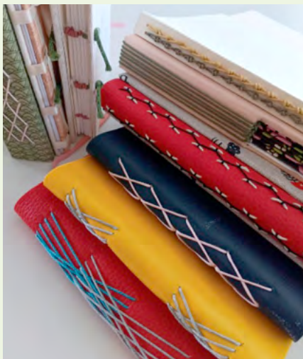
CASA DAS GERAÇÕES-BIBLIOTECA DA MURTOSA