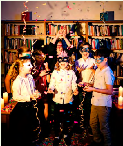
BIBLIOTECA MUNICIPAL DE SEVER DO VOUGA

Horário(s) 15h00 Promotor Município de Estarreja Público-alvo Público em geral