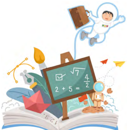
BIBLIOTECA MUNICIPAL MANUEL ALEGRE