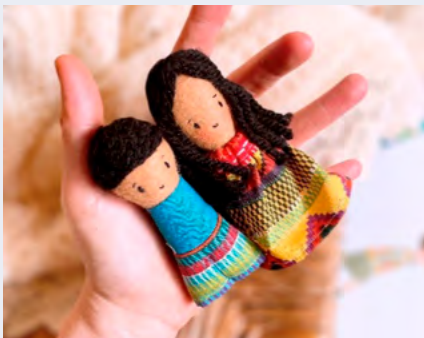
BIBLIOTECA MUNICIPAL DE OVAR