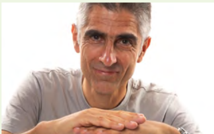
BIBLIOTECA MUNICIPAL DE ESTARREJA