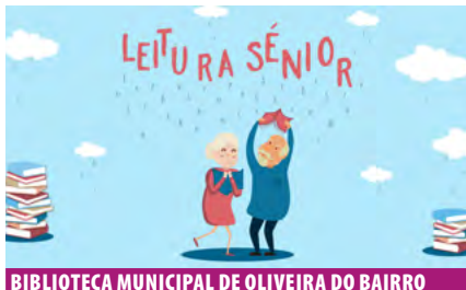
BIBLIOTECA MUNICIPAL DE OLIVEIRA DO BAIRRO

Todos os Ciclos de Ensino das Escolas do Município de Águeda