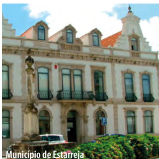
Município de Estarreja