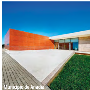
Município de Anadia