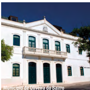
Município de Oliveira do Bairro