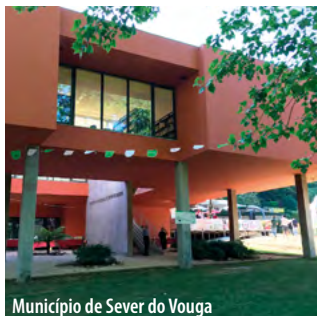
Município de Sever do Vouga