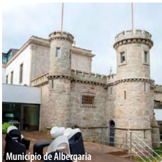
Município de Albergaria