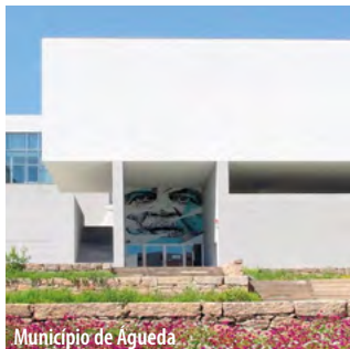
Município de Agueda