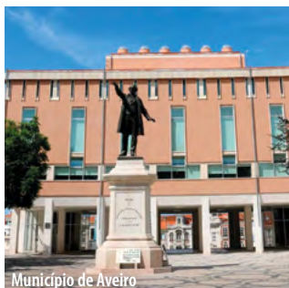
Município de Aveiro