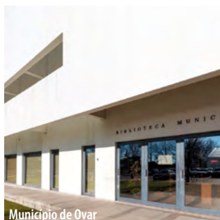
Município de Ovar