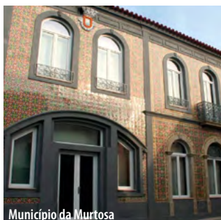
Município da Murtosa