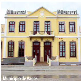
Município de Vagos