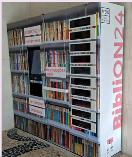
BIBLIOTECA MUNICIPAL DE AVEIRO