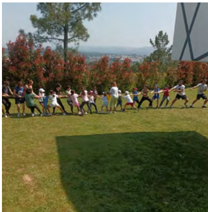
BIBLIOTECA MUNICIPAL DE ANADIA