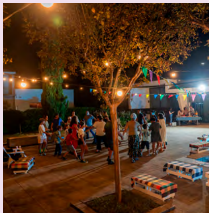
BIBLIOTECA MUNICIPAL DE ESTARREJA