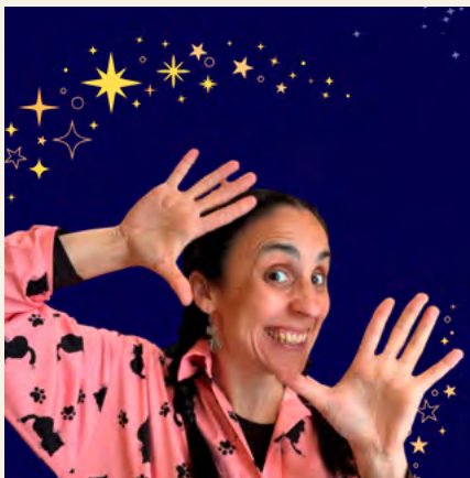
BIBLIOTECA MUNICIPAL DE OLIVEIRA DO BAIRRO