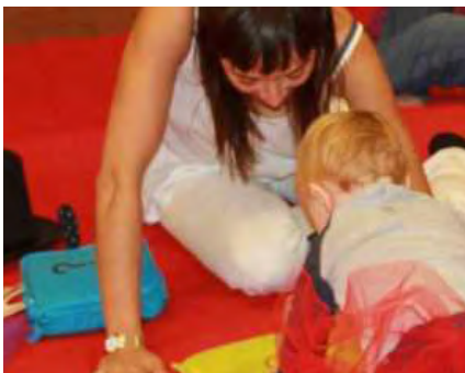
BIBLIOTECA MUNICIPAL DE ALBERGARIA-A-VELHA