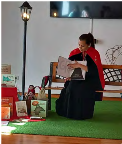
BIBLIOTECA MUNICIPAL DE ALBERGARIA-A-VELHA