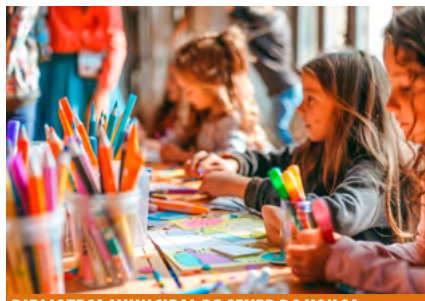
BIBLIOTECA MUNICIPAL DE SEVER DO VOUGA

Bebés dos 6 aos 36 meses + 1 acompanhante