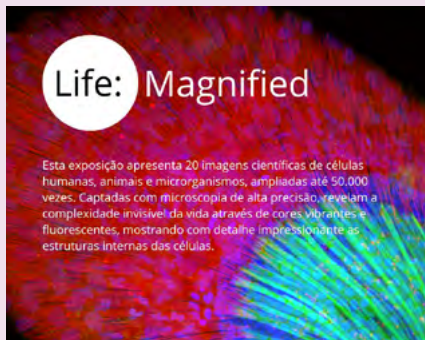
BIBLIOTECA MUNICIPAL JOÃO GRAVE – VAGOS

Com o BibliON24, a biblioteca está sempre aberta para os utilizadores inscritos. Podem levantar reservas, devolver e requisitar livros disponíveis a qualquer hora, todos os dias da semana. Mais liberdade, mais conveniência e acesso contínuo à leitura, independentemente do horário de funcionamento das instalações.