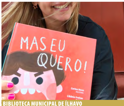
BIBLIOTECA MUNICIPAL DE ÍLHAVO