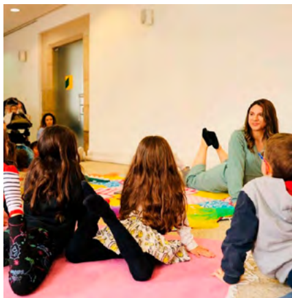
BIBLIOTECA MUNICIPAL DE AVEIRO

Público-alvo Famílias com crianças a partir dos 4 anos