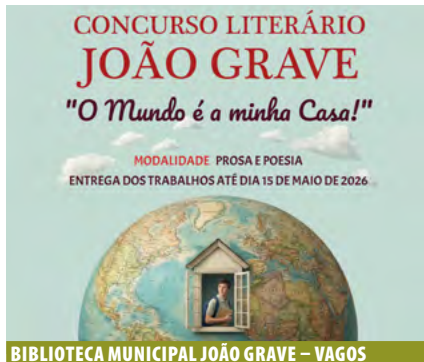
BIBLIOTECA MUNICIPAL JOÃO GRAVE – VAGOS

Crianças dos 4 aos 12 anos + 1 acompanhante