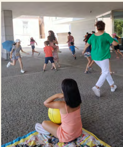
BIBLIOTECA MUNICIPAL MANUEL ALEGRE

+inf.: http://bm.cm-olb.pt | bmolb@cm-olb.pt | Tel. (+351) 234 732 117