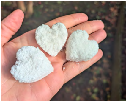
BIBLIOTECA MUNICIPAL DE ILHAVO

Horário(s) 11h00-12h00 Promotor Município de Anadia Público-alvo Famílias