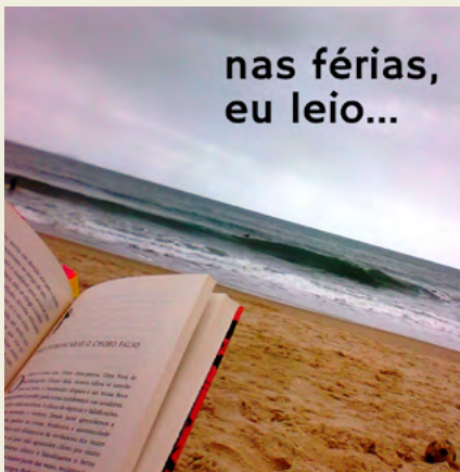
CASA DAS GERAÇÕES – BIBLIOTECA DA MURTOSA