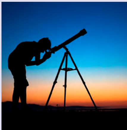
BIBLIOTECA MUNICIPAL DE ANADIA