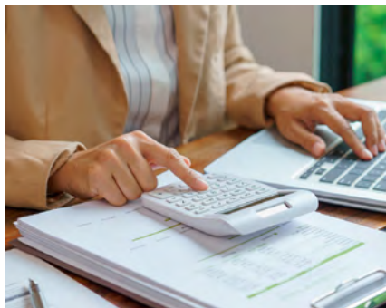
BIBLIOTECA MUNICIPAL DE ÍLHAVO