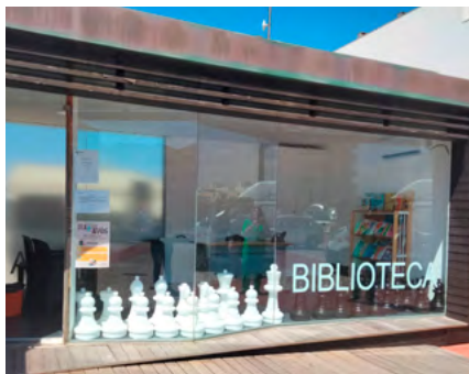
BIBLIOTECA MUNICIPAL JOÃO GRAVE – VAGOS