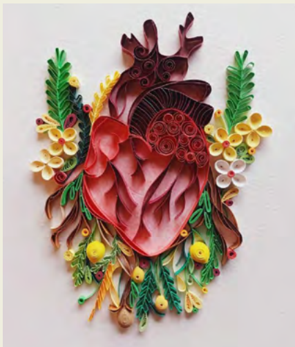
BIBLIOTECA MUNICIPAL DE ALBERGARIA-A-VELHA