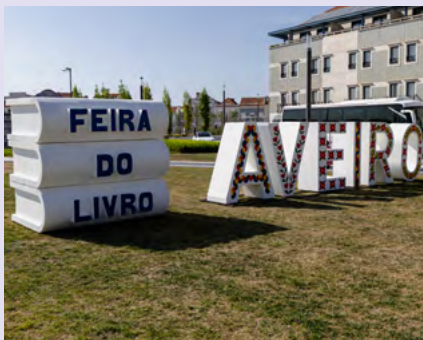
BIBLIOTECA MUNICIPAL DE AVEIRO

A participação é gratuita, mas de inscrição obrigatória que tem de ser efetuada até ao dia 24 de agosto. A sessão é dirigida a maiores de 6 anos.