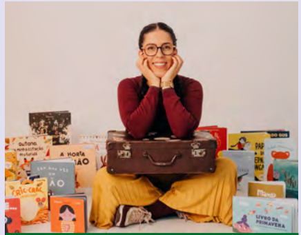
BIBLIOTECA MUNICIPAL DE ANADIA

+inf.: biblioteca.municipal@cm-estarreja.pt | Tel. (+351) 234 840 614