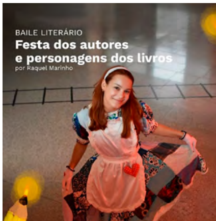
BIBLIOTECA MUNICIPAL DE SEVER DO VOUGA

Promotor Município de Vagos Público-alvo Público em geral