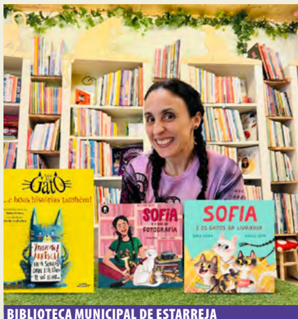
BIBLIOTECA MUNICIPAL DE ESTARREJA