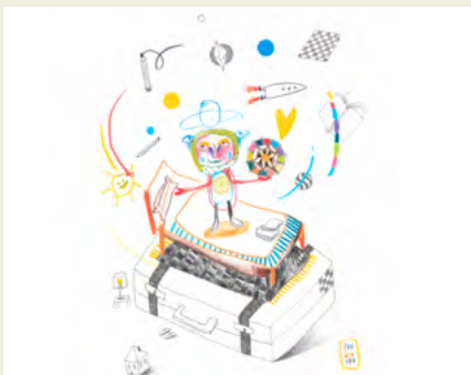
BIBLIOTECA MUNICIPAL MANUEL ALEGRE