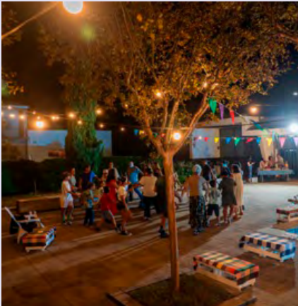
BIBLIOTECA MUNICIPAL DE ESTARREJA