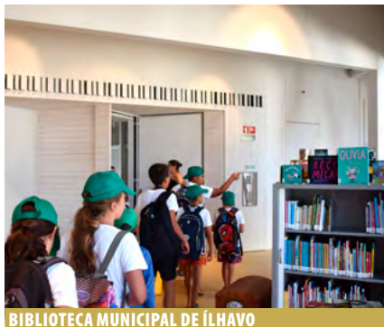
BIBLIOTECA MUNICIPAL DE ÍLHAVO

+inf: http://bm.cm-olb.pt | bmolb@cm-olb.pt | Tel. (+351) 234 732 117