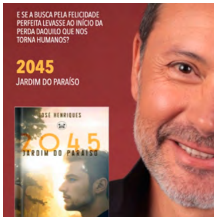
BIBLIOTECA MUNICIPAL DE SEVER DO VOUGA

Horário(s) Sáb.: 10h30 Promotor Biblioteca Municipal de Ílhavo Público-alvo Jovens e adultos