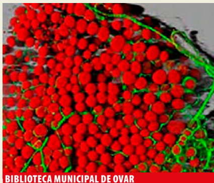
BIBLIOTECA MUNICIPAL DE OVAR

+inf.: biblioteca.municipal@cm-estarreja.pt | Tel. (+351) 234 840 614