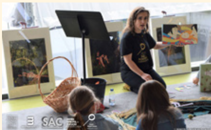
BIBLIOTECA MUNICIPAL DE ALBERGARIA-A-VELHA