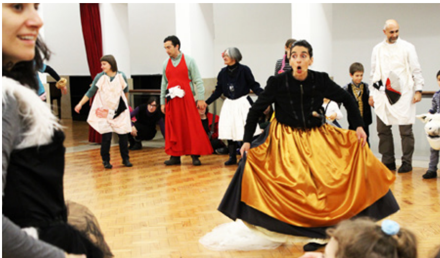
BIBLIOTECA MUNICIPAL DE ESTARREJA