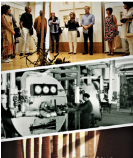
BIBLIOTECA MUNICIPAL DE ALBERGARIA-A-VELHA

2 A 30 ABRIL, 3 A 25 MAIO E 31 MAIO A 29 JUNHO