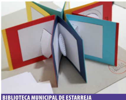
BIBLIOTECA MUNICIPAL DE ESTARREJA