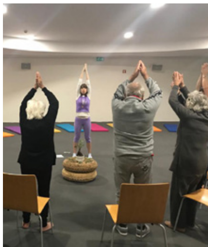
BIBLIOTECA MUNICIPAL MANUEL ALEGRE

Em Abril, mês do Dia Internacional do Livro e do Dia Mundial do Livro, a Biblioteca Municipal de Anadia entra em festa, distribuindo prémios variados aos utilizadores que requisitem domiciliariamente livros. Por cada livro requisitado, o utilizador recebe uma senha que o habilita a com conjunto de prémios diversos.