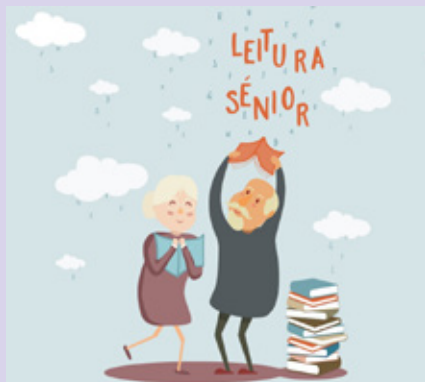
BIBLIOTECA MUNICIPAL DE OLIVEIRA DO BAIRRO

Horário(s) 14h30 Público-alvo Alunos e professores do secundário e público em geral.