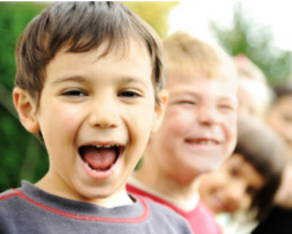
BIBLIOTECA MUNICIPAL DE ALBERGARIA-A-VELHA