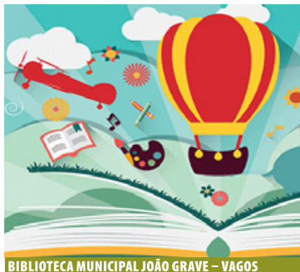
BIBLIOTECA MUNICIPAL JOÃO GRAVE – VAGOS