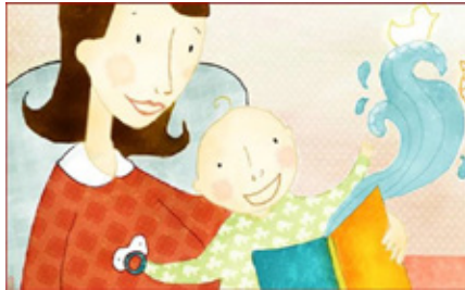
BIBLIOTECA MUNICIPAL JOÃO GRAVE – VAGOS

Público-alvo Famílias, Professores, Educadores e Profissionais de Saúde