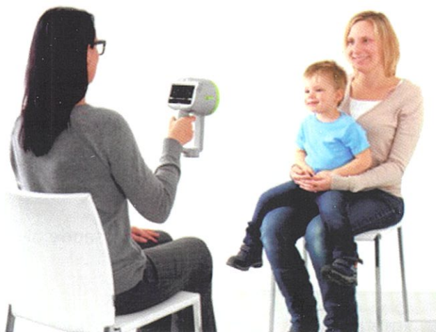
Realização do exame de rastreio

O resultado é enviado por carta para a sua residência. A sua equipa de saúde familiar também recebe essa informação.